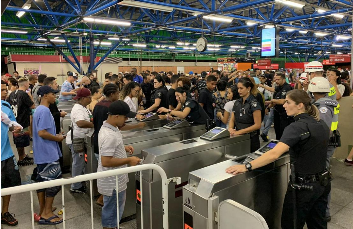
Figura 8 – Estratégia de Carnaval em execução