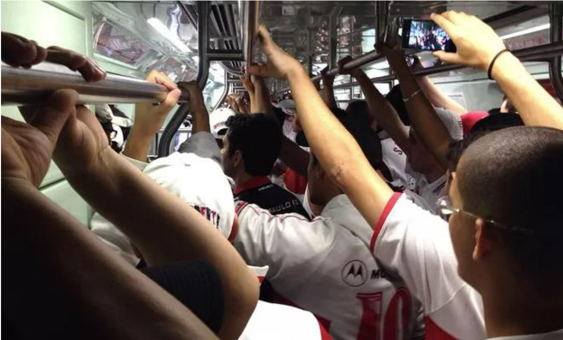
Figura 2 – Torcedores no interior do trem

Foi neste mesmo período que o grupo de inteligência passou a estreitar relacionamento com outros órgãos de segurança pública a fim de aumentar a gama de informações de ameaças.