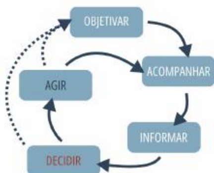
Figura 1 – Ciclo de inteligência 4

O ciclo da atividade segue o mesmo conceito: objetivar, acompanhar, informar e decidir e agir, sendo que a fase de decisão em regra é atribuição da Liderança, salvo quando identificado risco iminente o qual pode ocasionar dano irreparável ao Departamento e à Companhia, momento em que a ação deve ser imediata.