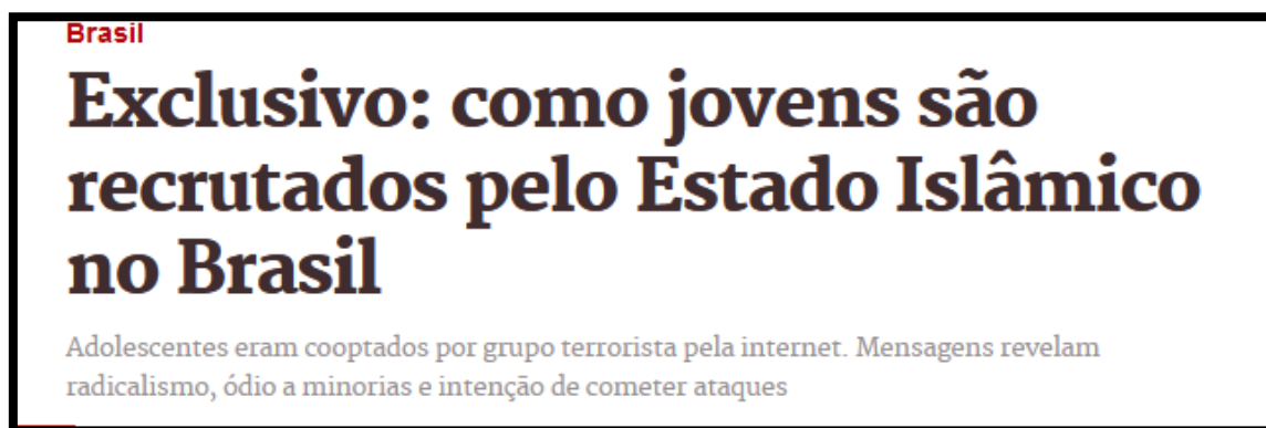
Figura 6 – Manchete sobre cooptação de jovens pelo Estado Islâmico 9

pequena célula do Isis (sigla em inglês do Estado Islâmico), alertada pelo serviço de inteligência do Marrocos, que recrutava adolescentes para integrar o grupo terrorista.