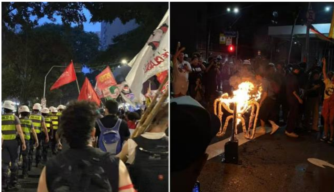
Figura 5 – Policiais Militares e manifestantes durante manifestação 8

Para o Metrô de São Paulo, este evento foi um marco para o incremento nas ações de prospecção e controle de eventos, sedimentando o trabalho que já estava sendo realizado com ações mais estruturadas que resultaram em eventos sem registro de transtornos para o sistema metroviário.