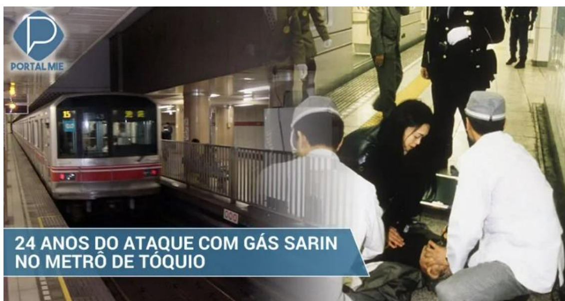
Figura 4 – Figura com imagem de Metrô do Japão e atendimento a vítima 7

No dia 20 de março de 1995 um ataque com gás sarin no Metrô de Tóquio deixou 13 mortos e 6300 pessoas adoecidas pelos efeitos do gás. Este ataque chamou atenção mundial uma vez que o Japão não apresentava histórico de ataques terroristas ou grandes episódios de violência e conflitos regionais que justificassem a ocorrência deste fato. Este evento trouxe um olhar mais aguçado para a possibilidade de incidência de eventos de tal natureza em locais não esperados.